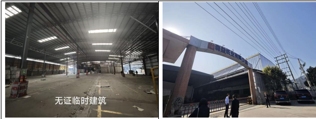
3. 东莞市东城区温塘庆峰花园银湖路 2 座 302